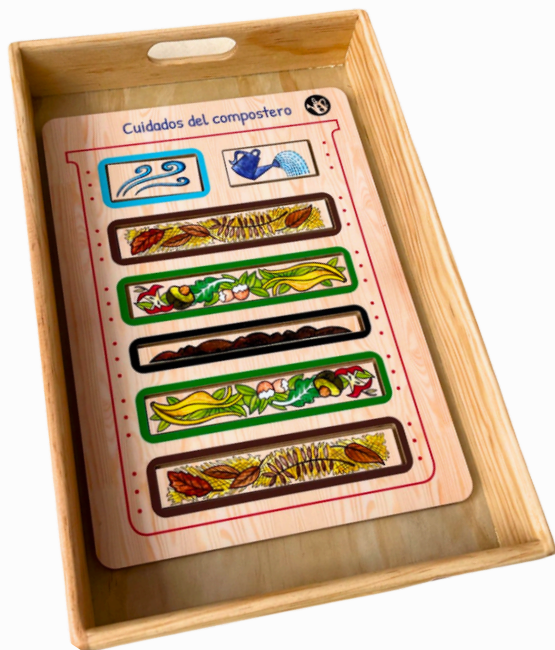
CUIDADOS DEL COMPOSTERO