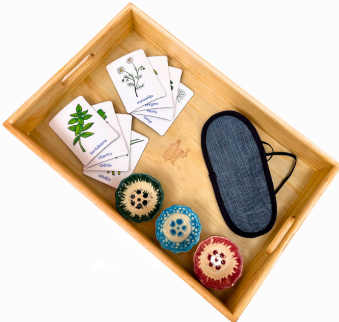
RECONOCER PLANTAS AROMÁTICAS