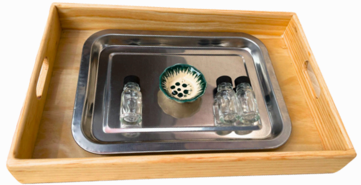
COSECHAR Y LIMPIAR SEMILLAS