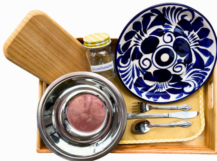
PREPARAR UNA ENSALADA kit complementario