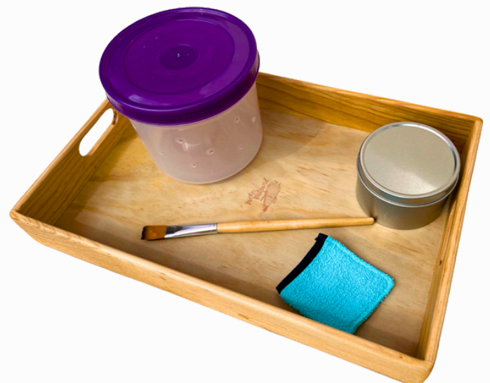
CUIDAR DE UN ANIMAL