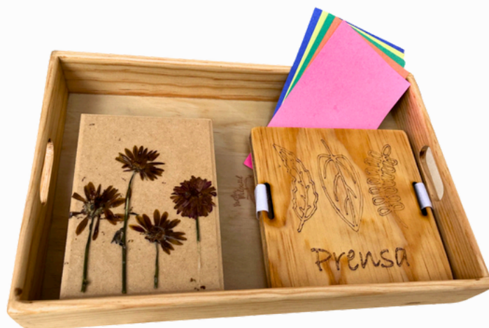
PRENSA DE HOJAS Y FLORES