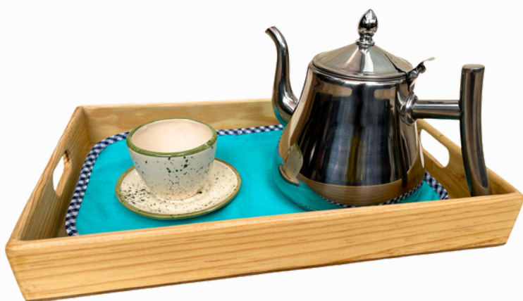
PREPARAR UNA INFUSIÓN kit complementario