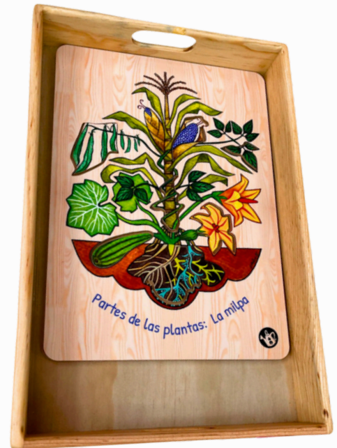
PARTES DE LAS PLANTAS