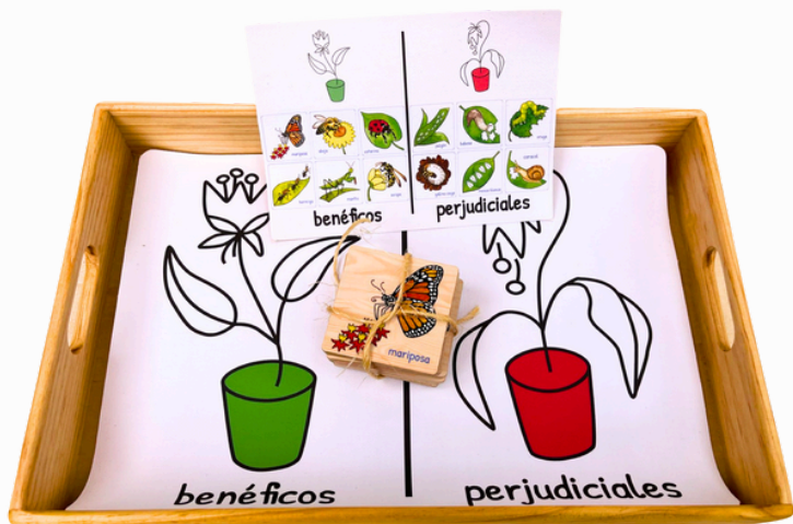
ANIMALES BENÉFICOS Y PERJUDICIALES