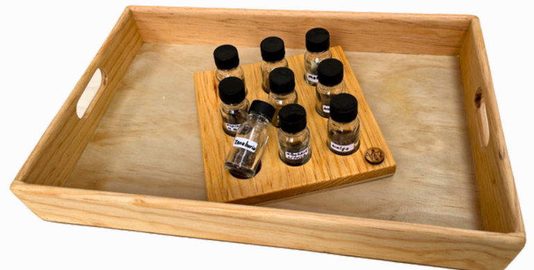
BANCO DE SEMILLAS

*no se incluyen tarjetas de cultivos en esta actividad