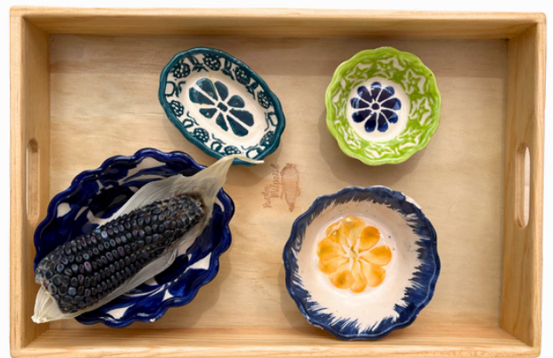
ORÍGEN DE LAS SEMILLAS